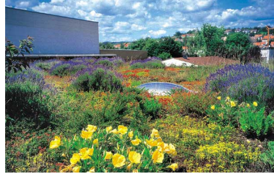
foto: 3 Çatı bahçesi

Çatı bahçeleri, teras çatılara kazandırılan işlevlerden bir diğereğidir. Bazı uzmanlara göre çatı yeşillendirme ve kullanımının kökeni, İÖ. 6. yüzyılda Babil kentindeki asma bahçeleri ile Asurlular'a dayanmaktadır. Bilinen birçok Bizans ve Hint minyatürlerinde verimli çatı bahçelerinin betimlenmesi, genel olarak çatı bahçesi konseptinin yaygınlığı fikrini vermektedir.