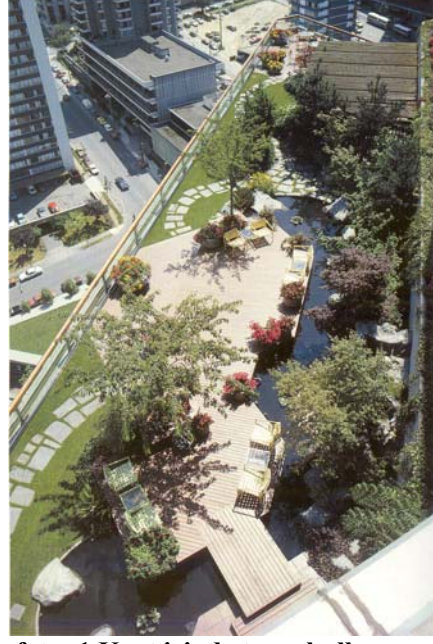
foto: 1 Kent içinde teras kullanımı

Bu hacimler, kuşbakışı bir manzara ve caddenin kargaşasından uzak bir atmosfer sunmaktadır. Bina düşey sirkülasyonu ve tesisat yeterliliği, güvenlik, gürültü gibi etkenlerin değerlendirilmesine bağlı olarak bu uygulamalar yaygınlaşmaktadır.