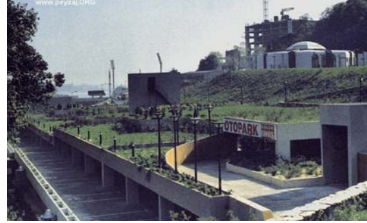
foto: 2 Köşklü Çiftlik Otopar

Teras çatılara kazandırılan işlevlerden diğeri de, otopark ve helikopter pisti gibi trafiğe yardımcı alanlardır. Kent merkezlerinde bulunan iş merkezi, hastane ya da kültür merkezi gibi binaların çatılarında, gerek duyulan otopark, helikopter pisti ve benzeri fonksiyonlar yer almaktadır.