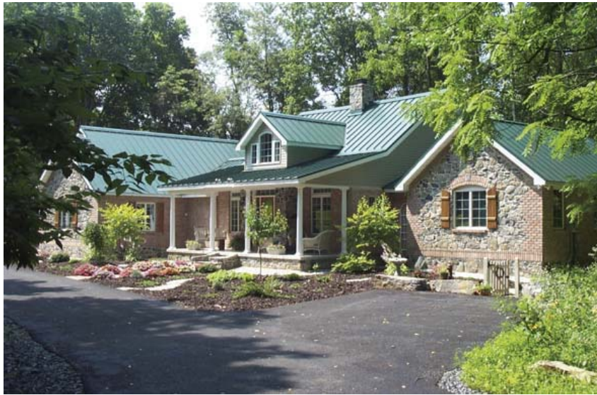
Şekil 4. Az katlı yapılarda çatı mimarinin en temel ögesidir

Az katlı konutlar ve villalarda çatı, mimarinin önemli bir ögesidir. Bu tür yapılarda çatının hem form hem de fonksiyon olarak önem kazanmasına neden olarak, yapı bütçesinden aldığı payın daha fazla olması gösterilebilir. Çatının algılanabilirliği, çatı üst kaplaması, aksesuarları ve saçaklarının ön plana çıkarmaktadır. Çatı kaplaması olarak, değişik malzeme arayışına cevap verecek farklı tip kiremitler, shingle kaplamalar ve dekoratif fonlu alüminyum ve sac kaplamalar ve bunlar gibi geniş bir ürün gurubu inşaat sektörüne sunulmuştur. Bacalar, havalandırma menfezleri, çatı pencereleri, yağmur olukları ve saçak alın kaplamaları gibi elemanlar ise doğru malzeme, renk ve fon tercihleri ile çatı mimarisine büyük katkı yapabilen aksesuarlar haline gelebilmektedirler.