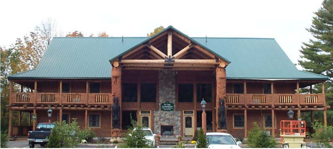
Şekil 5 Çatının yapı ve çevre ile uyumu

Prestij yapıları dediğimiz ve çatının mimaride fazlaca kullanılabildiği yapılar; mağazalar, lokantalar, müzeler ve bir takım sosyal tesislerdir. Bu tür yapılarda bina bir heykel veya resim gibi bir sanat eseri olarak ortaya konulmak istendiğinde, form işlevin önüne geçmekte ve bu durum çatı oluşumuna da yansımaktadır. Bu tür yapılarda her türlü form ve özel detay farklılık ve prestij amaçlı olarak abartılı şekilde kullanılmaktadır. Az yağış alan sıcak iklim bölgelerinde eğimi kırk dereceyi aşan çatılara rastlanıldığı gibi bazen soğuk bölgelerde teras çatı uygulamaları görülmektedir. Dolayısı ile tasarımcı etkileyici bir form yakalamak adına maliyet ve malzeme kullanım ömrü açısından önerilmeyen detaylar kullanabilmektedir. Bu nedenle bu tür “dekoratif uygulamalar” için genel önerilerde bulunmak doğru değildir ve arzulanan tek ve kendine özgü bir tasarımlar oluşturabilmektedir.