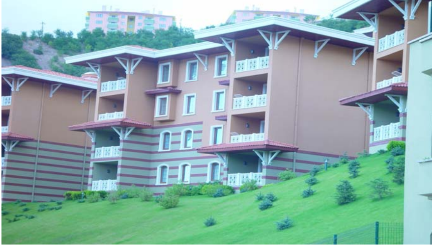
Şekil 3 Apartman yapılarında çatı saçak ve kornişleri mimariye katkı yapabilir

Çatı arası piyeslerine alan ve ışık kazandırmak için açılan pencereler, çatı formunda bozulmalara ve problemlere detaylarının oluşumuna sebep olmaktadır. Bu tür çatıların kütlesi mutlaka marangoz levhaları (OSB, Kontraplak v.b) ile oluşturulmalı ve üzerine yapılacak sızdırmazlık tabakası tercihi esnek bitümlü pestil olmalıdır. Farklı eğimler ve çok miktarda mahya ve dere olan çatılarda üst kaplama olarak kiremit türü malzemeler yerine kesilmesi ve şekil alması daha kolay olan shingle benzeri malzemeler tercih edilmelidir. Çatı arasında üzerinde gezilmeyen bölgelerde ısı yalıtımı korunması açısından döşeme üzerine değil tavana ve mertek aralarına konulmalıdır.