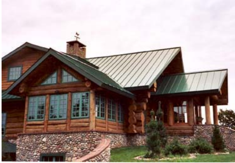
Şekil 1 Çatıda üst kaplama malzemesi mimari ve estetik gereksinimleri karşılamalıdır.

Çatı kaplamalarından beklenen performansı sağlayabilmek için öncelikle verilmesi gereken karar, çatı eğimi ve formu konusundadır. Eğimi fazla olan ve parabolik formlar içeren çatılar için kolay şekil alıp uygulanabilen, hafif ve yüzeyi fazla kaygan olmayan malzemeler seçilmelidir. Bu tanıma uygun olarak kullanılabilen malzemeler piyasada “shingle” adıyla bilinen pestiller ve metal çatı kaplamalardır . En fazla tercih edilen çatı metalleri sırasıyla; galvaniz boyalı sac, alüminyum, bakır, çinko ve kurşundur. Kurşun, Bakır ve çinko gibi metal levhaların yüksek maliyetleri ve zahmetli işçilikleri sebebiyle bitüm ve asfalt emülsiyonları içeren pestil şeklindeki kaplama malzemeleri ile alüminyum ve galvaniz sac kaplamalar bu tür çatılar için uygun kabul edilebilir. Ancak, pestillerde gerek üretici firma çeşitliliği gerekse ürün ve üretim farklılıkları nedeniyle uygulama performansını etkileyecek olumsuzluklar tespit edilmektedir. Örneğin görünüş olarak oldukça dekoratif olan iki farklı marka shingle arasında esneklik ve sızdırmazlık açısından büyük farklar ortaya çıkabilmektedir.